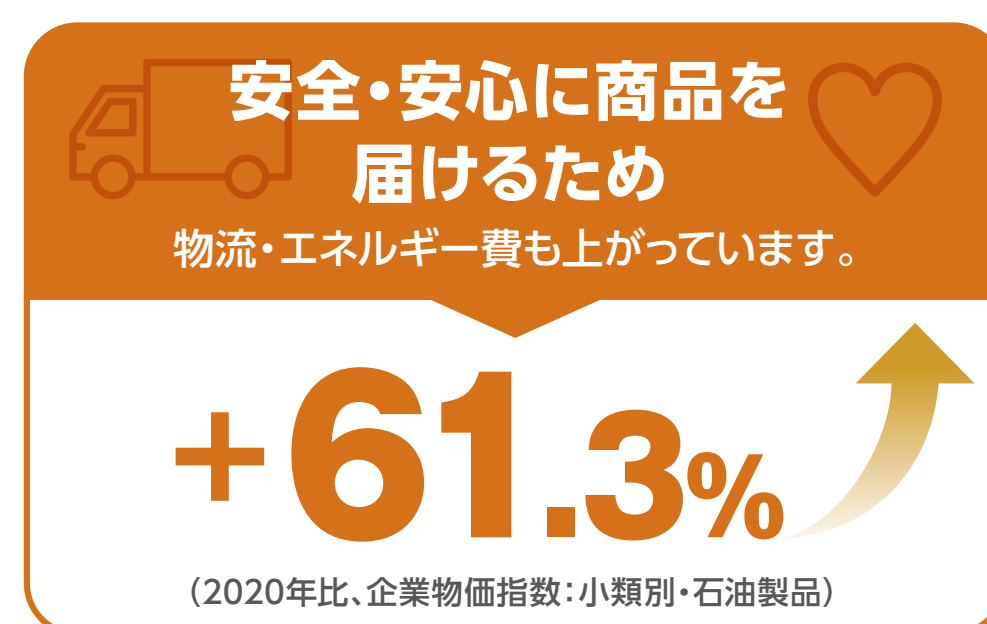
過去5年の熊本県に関連する各コスト推移