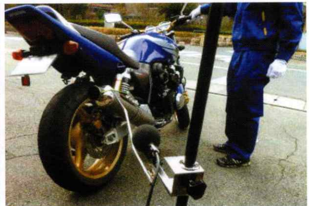
不正改造車両の取締り