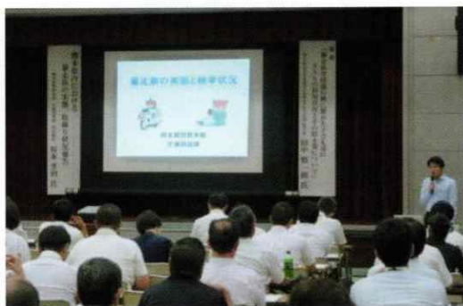
熊本市暴走族根絶連絡協議会総会の開催状況

官民一体となって暴走族を許さない社会環境づくりを推進するために、関係機関等との連携を図り、「暴走をしない、させない、見に行かない運動」を推進し、「暴走族を許さない環境」の醸成を図るための諸活動を行っています。