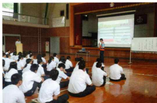
中学・高校における暴走族加入阻止教室の開催状況

暴走族に関心をもつ中学生・高校生に対して、犯罪グループとなっている暴走族の実態を理解させ、グループへの加入を阻止するための「暴走族加入阻止教室」を開催しています。