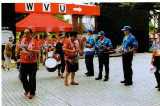
キャンペーンの開催状況