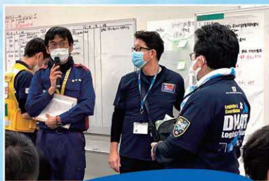
九州 DMAT 研修訓練