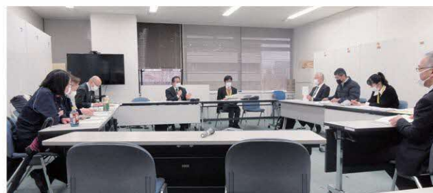
熊本県保健所長会の様子

熊本県は、ご出身じゃない方も住みやすい土地です。阿蘇はいるだけでパワーをもらえますし、天草では絶品の海の幸が楽しめます。人吉は別名「おひとよし」と呼ばれ、温泉もあり身体も心もぼかぼかになります。熊本県で働いてみようかな?と思われたら、お気軽にご相談ください。お待ちしております!