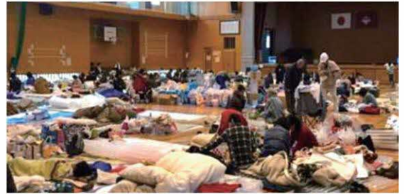
平成28年 熊本地震 避難所

時代や社会の変化の下で行政の医師の担う役割はダイナミックで退屈する暇はありません。知識や考え方を学ぶ研修の機会はしっかり提供されます。チームワークを常に意識し各方面のサポートを得ながらの業務は「やりがい」にあふれています。ご興味をもたれたら、ぜひ熊本県に連絡ください！