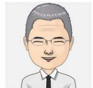
保健所勤務の公衆衛生医師 とある一週間のスケジュール

また、災害発生時には、保健所に地域の保健医療福祉調整本部が設置され、保健所長は指揮官として災害対応にあたります。