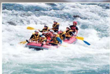
ラフティング (人吉球磨地域)