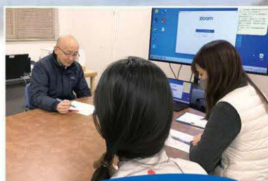
保健所内打ち合わせ