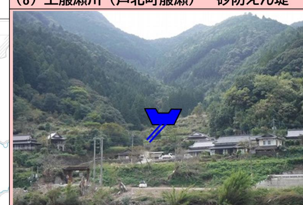
(8) 上籠瀬川 (芦北町籠瀬) 砂防えん堤