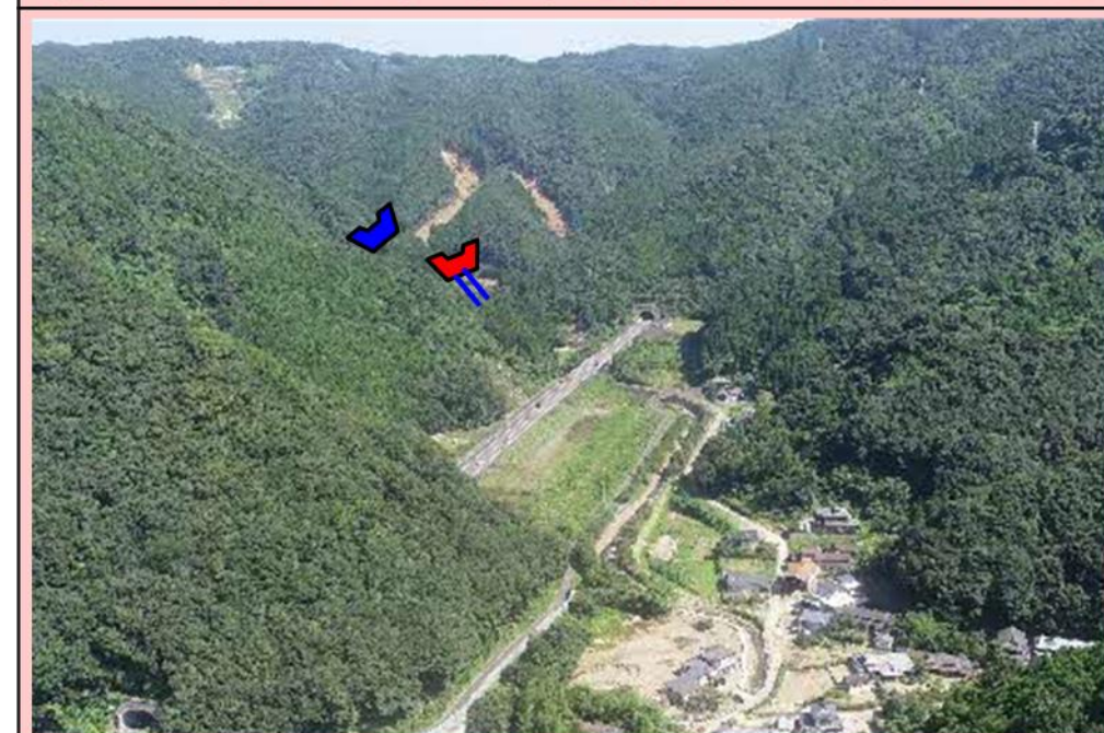
(3) 乙千屋川 (芦北町乙千屋) 砂防えん堤