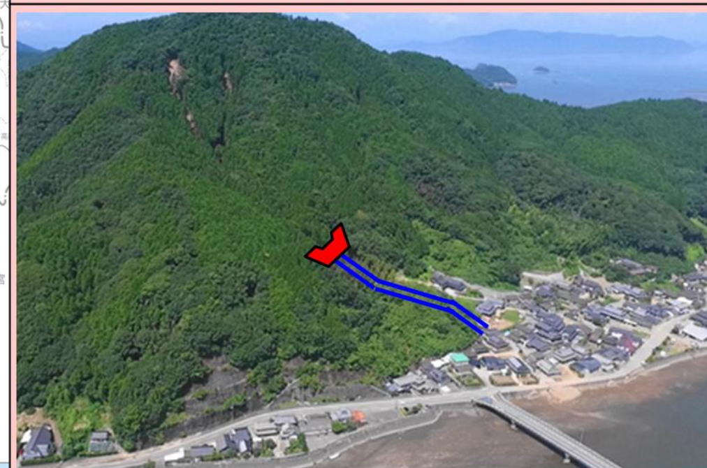
(2) 上平生川-1 (芦北町女島) 砂防えん堤