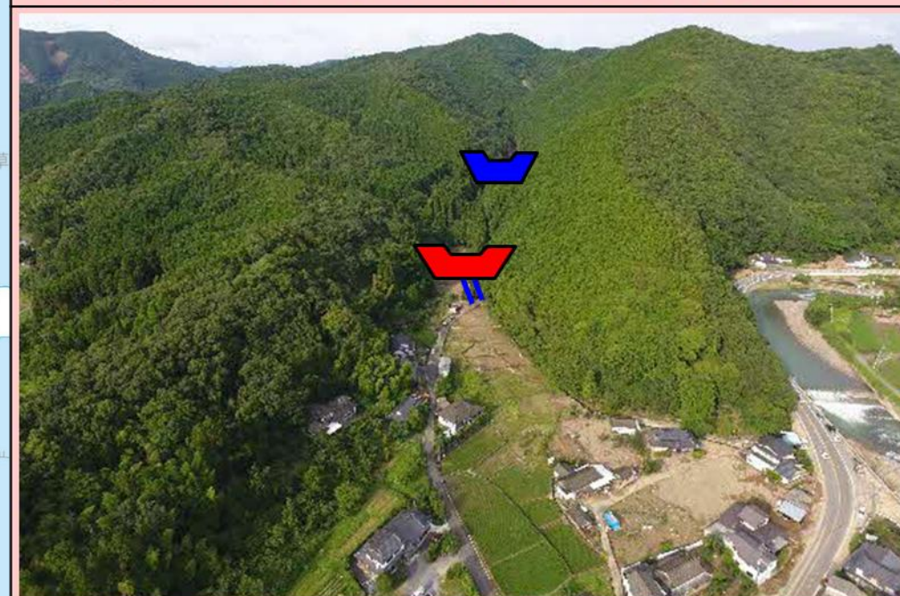
(4) 園口川 (芦北町八幡) 砂防えん堤