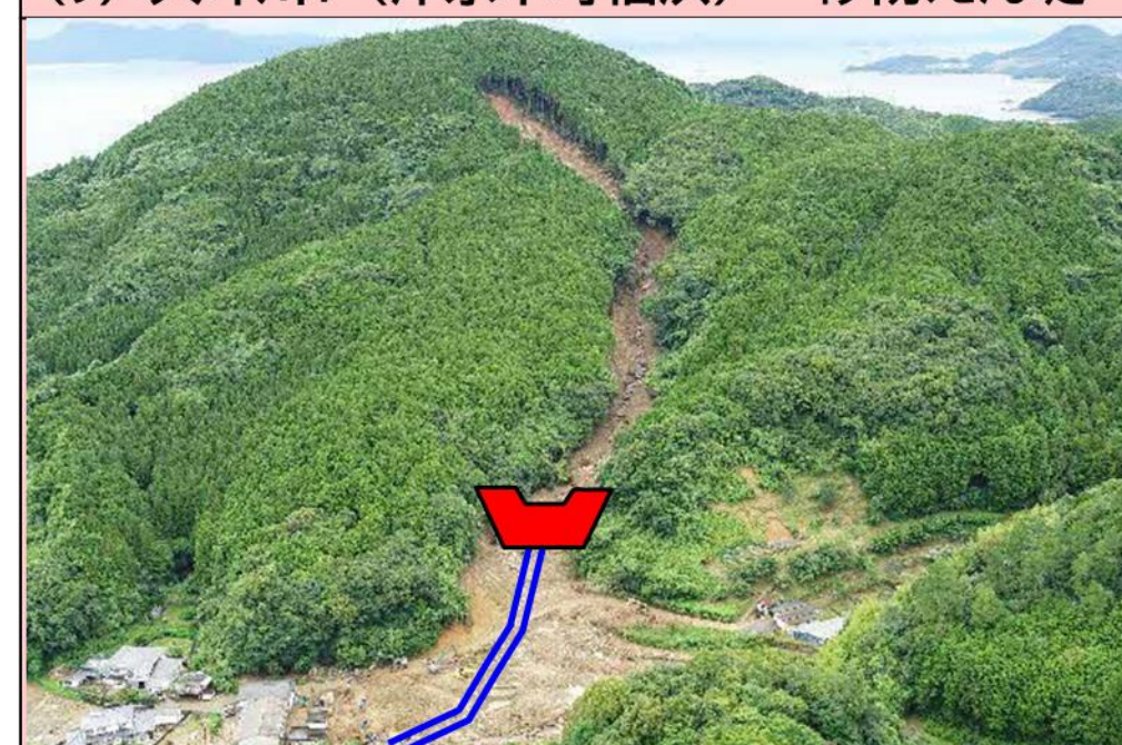
(9) 大坪川1 (津奈木町福浜) 砂防えん堤