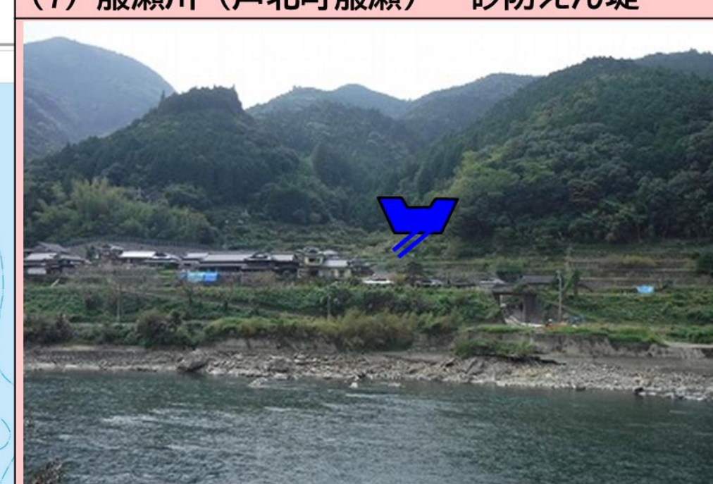
(7) 籠瀬川 (芦北町籠瀬) 砂防えん堤