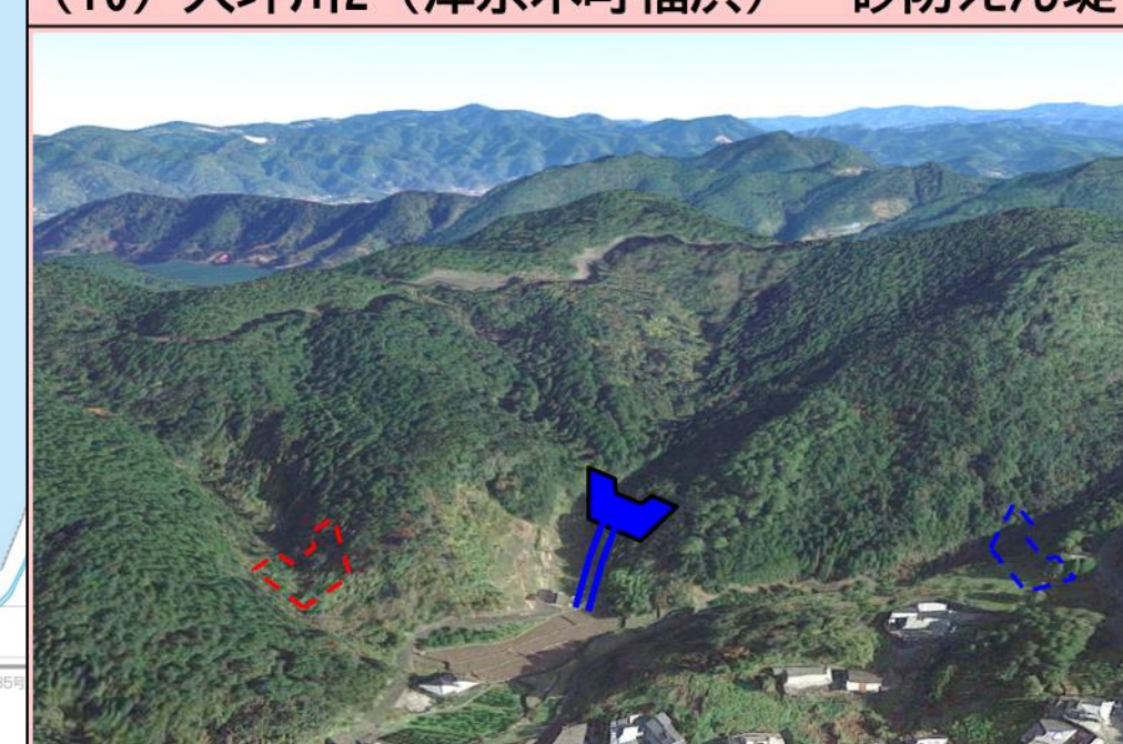
(10) 大坪川2 (津奈木町福浜) 砂防えん堤