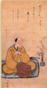
竹原玄路筆《細川重賢像》江戸時代(18世紀) 永青文庫蔵(後期展示)