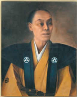
光永眠雷《横井小楠像》 明治～大正時代 横井小楠記念館蔵(通期展示)