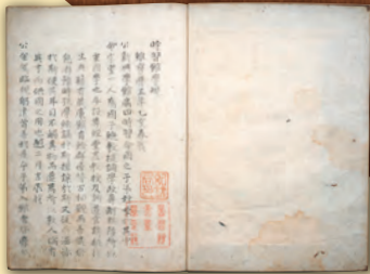
《時習館学規》宝暦5年(1755) 永青文庫蔵 熊本大学附属図書館寄託 ※前期・後期で展示箇所を変更