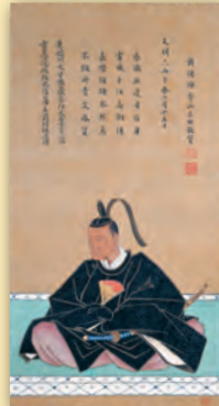
竹原玄路筆《細川重賢像》天明6年(1786) 永青文庫蔵(前期展示)