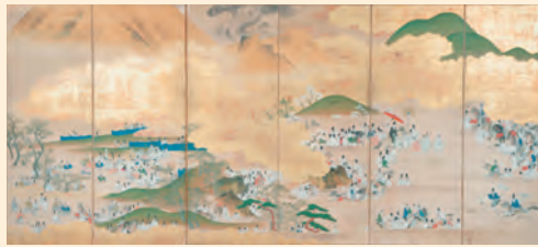
《阿蘇下野狩図屏風》左隻 江戸時代中期(18世紀) 永青文庫蔵 熊本県立美術館寄託