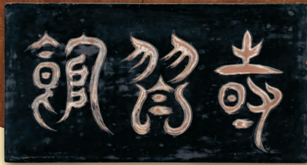
秋山玉山筆《時習館扁額》宝暦5年(1755) 永青文庫蔵(通期展示)