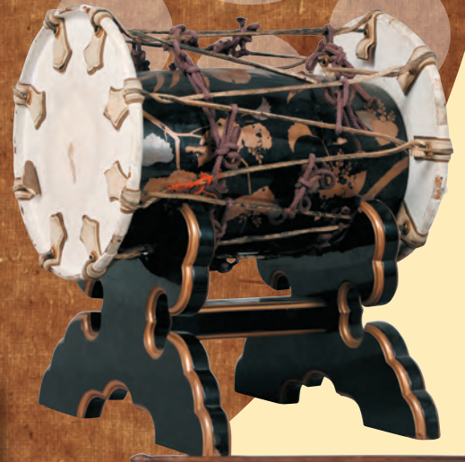
《時習館鞆鼓》江戸時代 永青文庫蔵(通期展示)

本展は、時習館の設立経緯や教育活動の様子、そこから巣立っていった人材の活躍を紹介するものです。ぜひ、この機会に熊本藩の藩校時習館の歴史とその役割をご覧ください。