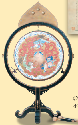
《時習館太鼓》文政10年(1827) 永青文庫蔵(通期展示)