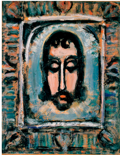
《聖顔》1939年 パナソニック汐留ミュージアム所蔵 G0033

フランス絵画の巨匠として名高いジョルジュ・ルオー (1871-1958) は、太く黒い線と鮮やかな色彩を駆使しながら独自の精神世界を開いた、20世紀を代表する画家です。敬虔なカトリック信者の家に生まれ、ステンドグラス職人の弟子として修業したのち、エコール・デ・ボザール (国立美術学校) でギュスターヴ・モローの教室に学んでいます。初期には20世紀絵画の発火点となった野獣派 (フォーヴィスム) の運動に加わり、マティスやヴラマンクらと活動をともにしながら、絵画の革新に携わりました。しかしルオーの関心事は単なる造形的な探求を超えて、人間の魂の姿を描き出すことでした。彼が最大の主題にしたのがキリストの受難など聖書のテーマであり、サーカスの道化師や貧しい労働者といった人々にも目を向けています。私たち人間が抱える苦しみや悲しみを正面から見すえ続けたルオーの作品は、今なお多くの人々を惹きつけてやみません。