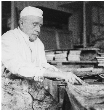
ジョルジュ・ルオー (パリのアトリエにて、1953年)

フランス絵画の巨匠として名高いジョルジュ・ルオー (1871-1958) は、太く黒い線と鮮やかな色彩を駆使しながら独自の精神世界を開いた、20世紀を代表する画家です。敬虔なカトリック信者の家に生まれ、ステンドグラス職人の弟子として修業したのち、エコール・デ・ボザール (国立美術学校) でギュスターヴ・モローの教室に学んでいます。初期には20世紀絵画の発火点となった野獣派 (フォーヴィスム) の運動に加わり、マティスやヴラマンクらと活動をともにしながら、絵画の革新に携わりました。しかしルオーの関心事は単なる造形的な探求を超えて、人間の魂の姿を描き出すことでした。彼が最大の主題にしたのがキリストの受難など聖書のテーマであり、サーカスの道化師や貧しい労働者といった人々にも目を向けています。私たち人間が抱える苦しみや悲しみを正面から見すえ続けたルオーの作品は、今なお多くの人々を惹きつけてやみません。