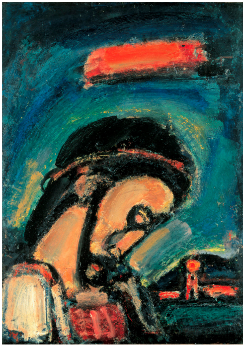
《キリスト》1937-1938年 パナソニック汐留ミュージアム所蔵 《キリストと漁夫たち》1947年頃 パナソニック汐留ミュージアム所蔵