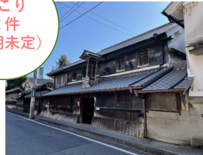
国重要文化財「吉田松花堂」