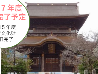
復旧した阿蘇神社楼門