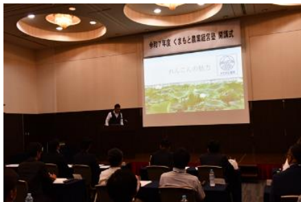
修了生による経営事例紹介