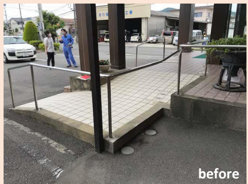
●アプローチの整備 (スロープ・手すり)