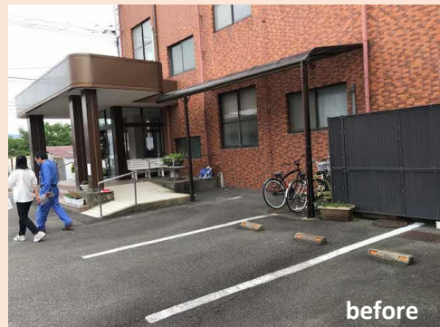
●車いす利用者用駐車場の整備