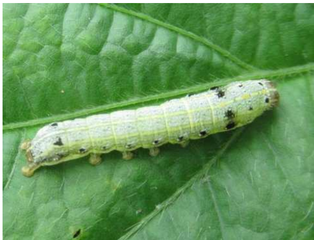
ハスモンヨトウの幼虫