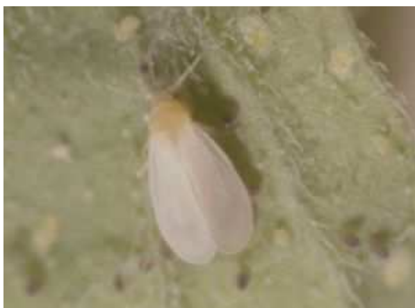
オンシツコナジラミ成虫