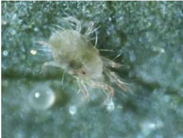
ナミハダニの成虫