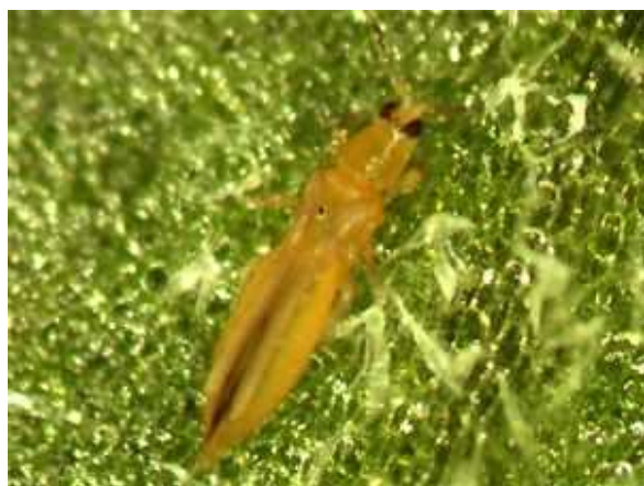
ミナミキイロアザミウマの成虫