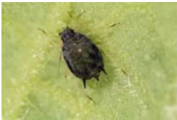
ワタアブラムシの成虫