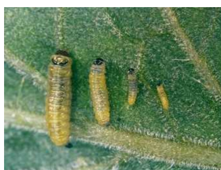
トマトキバガ幼虫 (左から4齢、3齢、2齢、1齢)