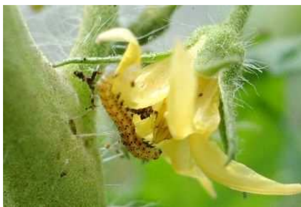
オオタバコガの幼虫