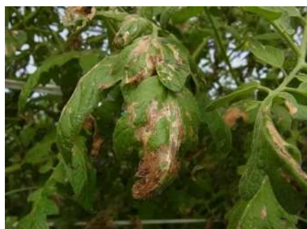
トマトキバガ幼虫による被害葉