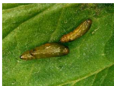
トマトキバガの蛹