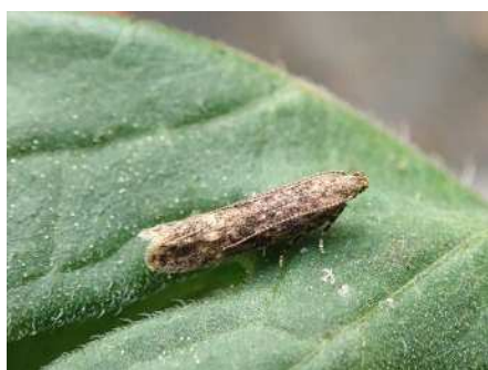
トマトキバガの成虫