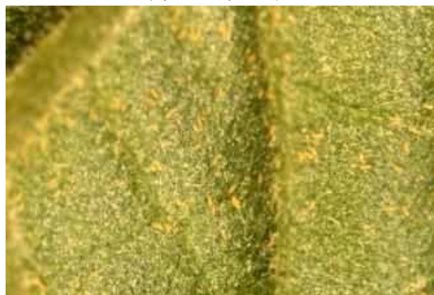
葉裏への寄生の様子