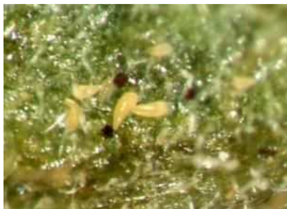
トマトサビダニの成虫