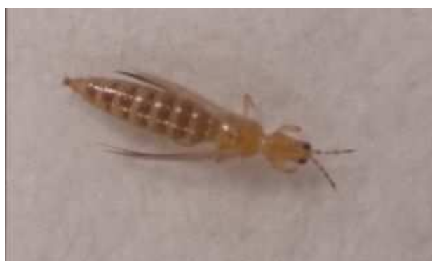
ミカンキイロアザミウマの成虫