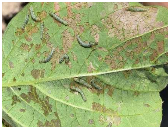
ハスモンヨトウ幼虫及び葉の食害