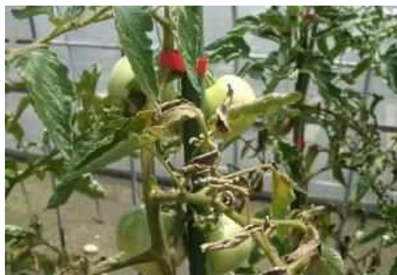
トマトでの被害症状（葉の黄化）