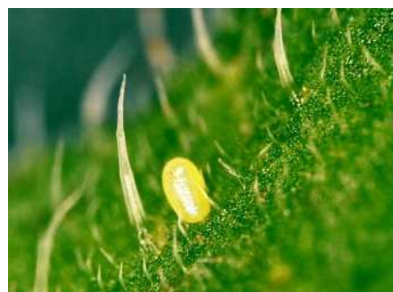
トマトキバガの卵