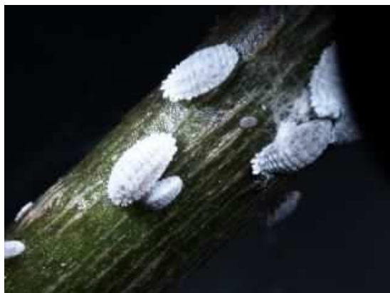
ナスコナカイガラムシの成虫