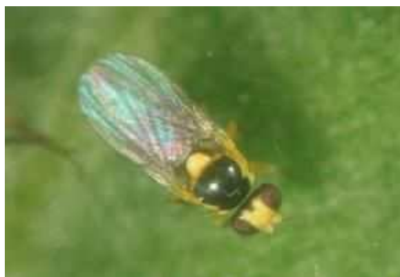
トマトハモグリバエの成虫