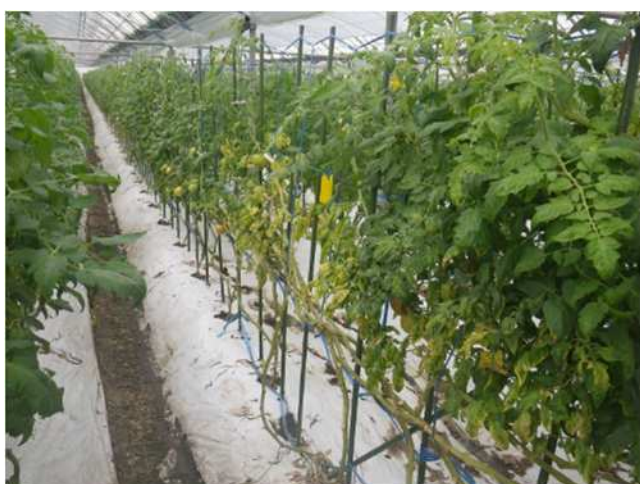
黄化病 (TOCV) による症状