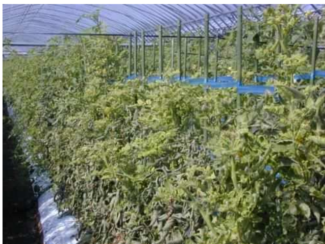
黄化葉巻病 (TYLCV) による症状