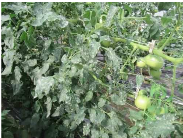
ほ場での症状（外生）