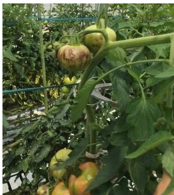
ほ場におけるT oMV感染株の様子