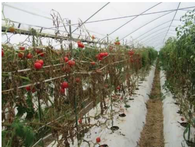
地上部の症状（萎ちょう・枯死）