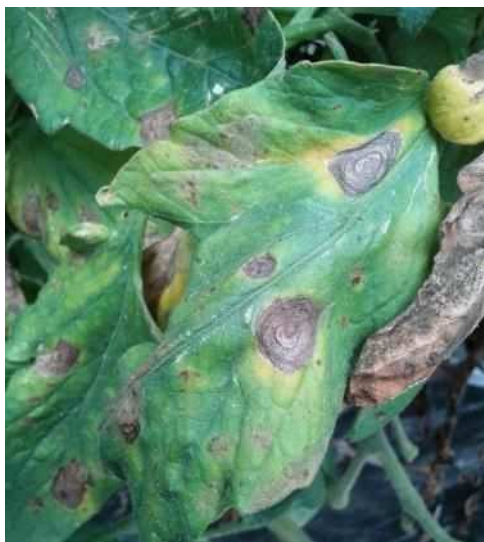
葉の同心輪紋病斑