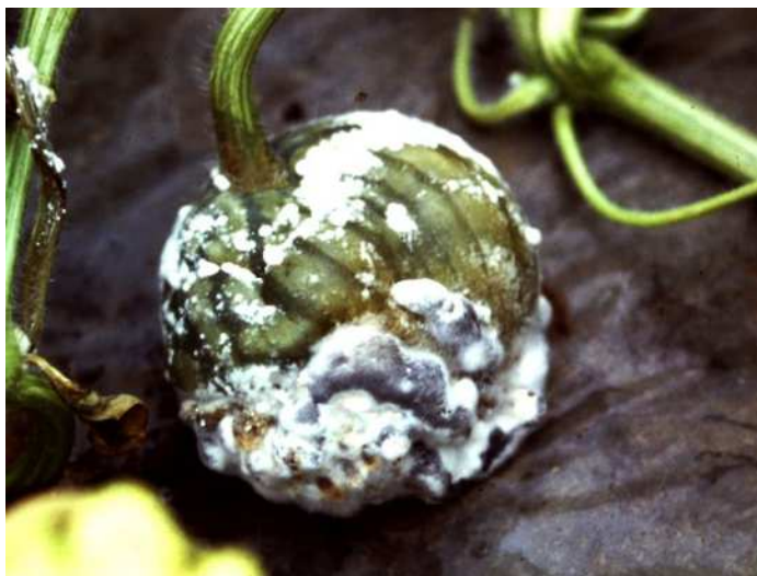
白色綿毛状の菌糸を生じた果実