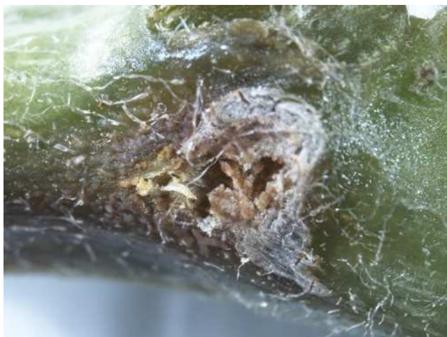
病斑上の鮭肉色分生子塊