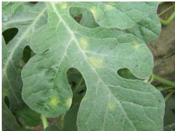
葉に発生した初期病斑