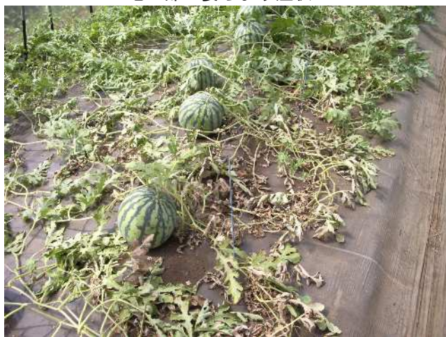
地上部の萎ちょう症状