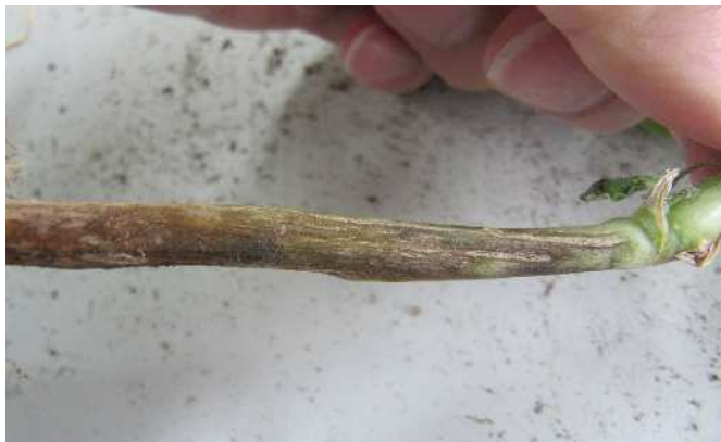
地際部の被害症状（変色・割れ目）