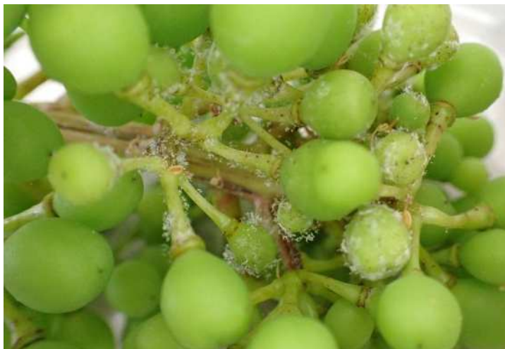
果実が発生したべと病斑