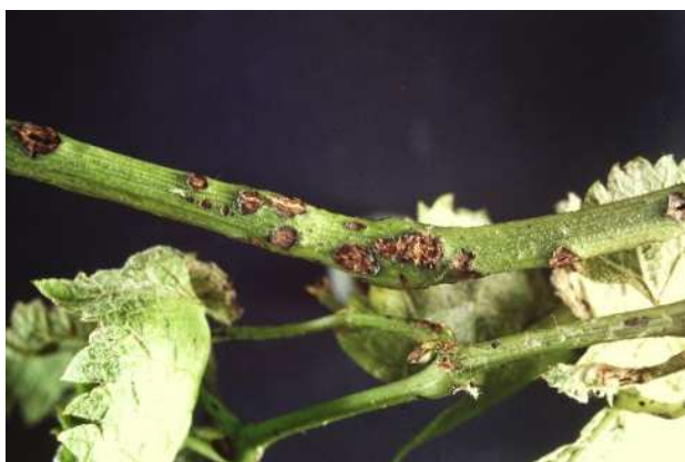
新梢における病斑