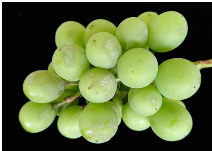
果実に発生したうどんこ病斑