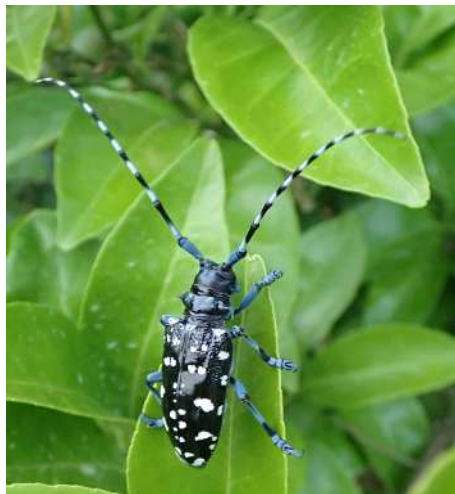
ゴマダラカミキリ成虫