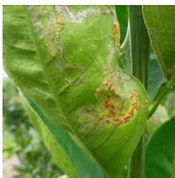
食害痕からの感染