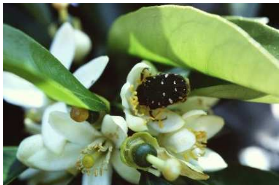
コアオハナムグリ成虫