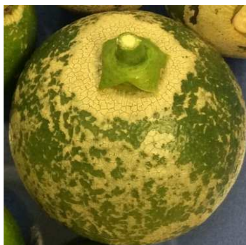
ハウスミカン幼果の被害