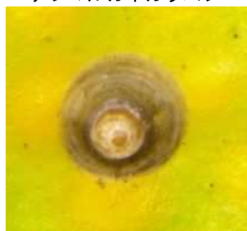
ナシマルカイガラムシ