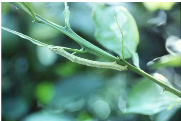
ヨモギエダシャク中齢幼虫