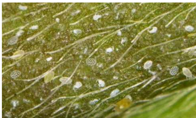
チャノホコリダニの卵と幼虫