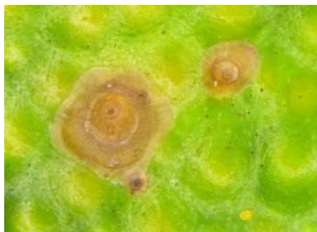
アカマルカイガラムシ（左：雌成虫、右：幼虫）