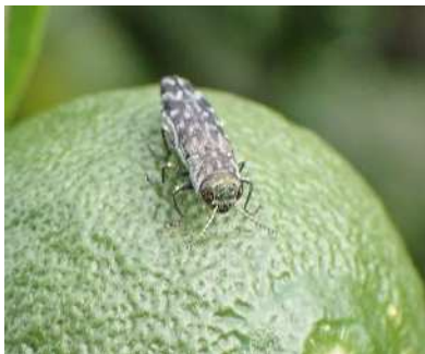
ミカンナガタムシ成虫