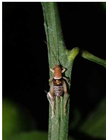
カネタタキ雄成虫