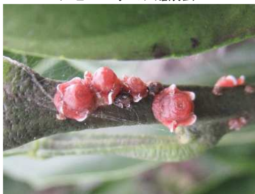
ルビーロウムシ雌成虫