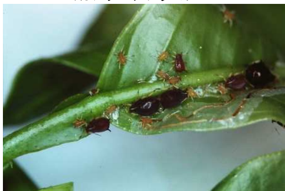
ミカンクロアブラムシ