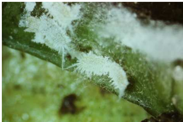
ミカンコナカイガラムシ雌成虫