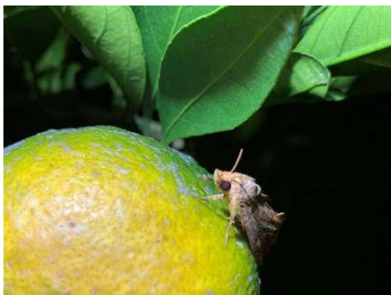
果実を吸汁加害するヒメエグリバ成虫