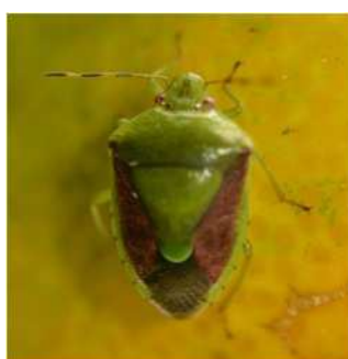
チャバネアオカメムシ成虫