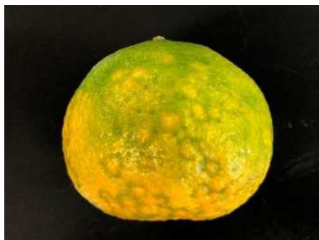
カンキツモザイク病 (CiMV)