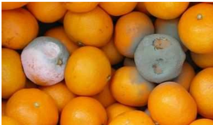
緑かび病の発病果実