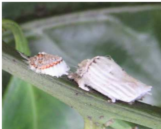
イセリアカイガラムシ雌成虫