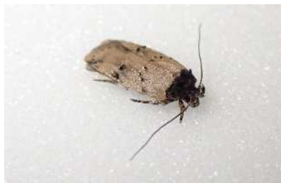
ミカンマルハキバガ成虫