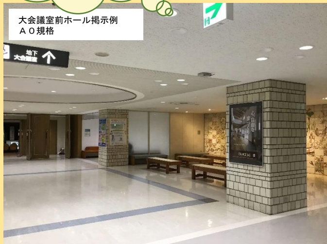
大会議室前ホール掲示例 A0規格