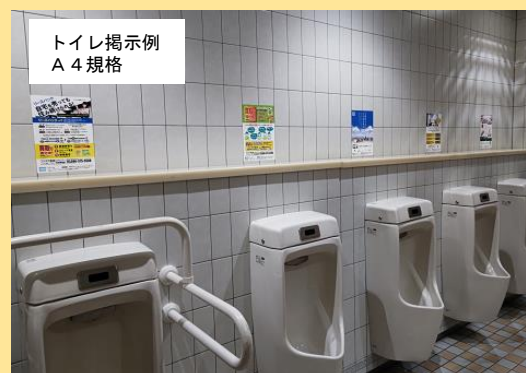
トイレ掲示例 A4規格