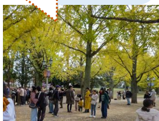
【正門】 【プロムナード】

54本ものイチョウ並木が。 秋には足元いっぱいに広がる黄色い絨毯のもと、 沢山の人が集います！