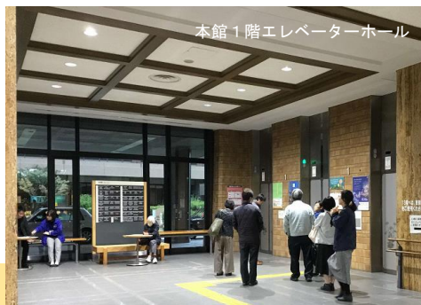
本館1階エレベーターホール