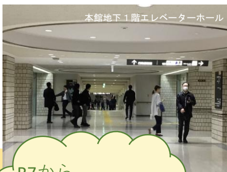
本館地下1階エレベーターホール