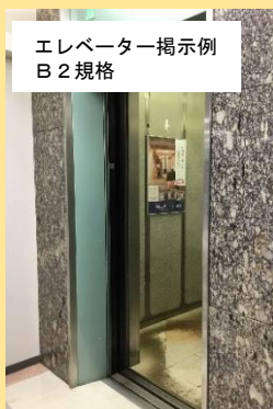
エレベーター掲示例 B2規格