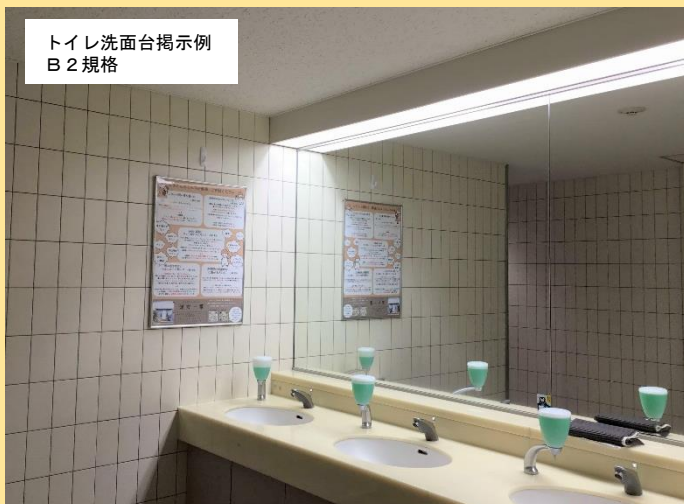
トイレ洗面台掲示例 B2規格