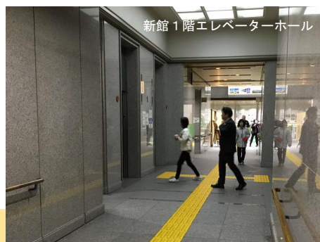
新館1階エレベーターホール