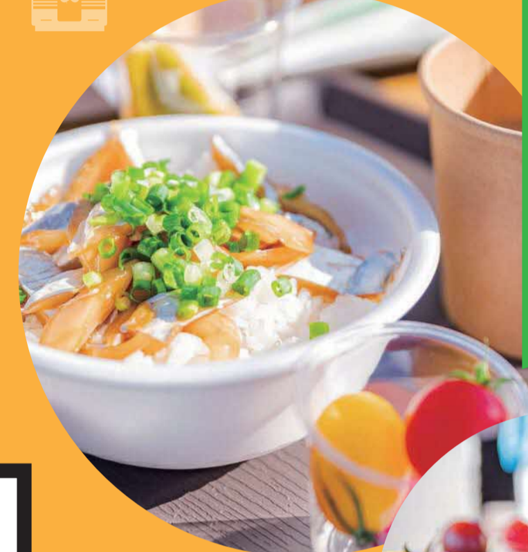
過去のエイド写真