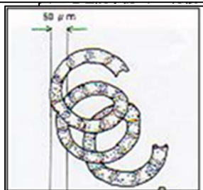
ユーカンピア属 Eucampia spp.