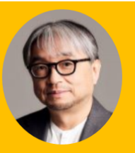
小山 薫堂 (こやま くんどう)