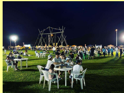
【キャンプ場イベントの様子】