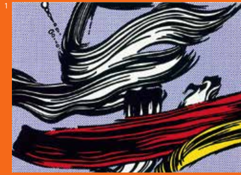
1 ロイ・リキテンスタイン《Brush Strokes》1967年 熊本県立美術館蔵 © Estate of Roy Lichtenstein, New York & JASPAR, Tokyo, 2024 X0267

ミッフィーと一緒に、熊本県立美術館のコレクションを見てみましょう。絵画や版画、彫刻や工芸など、さまざまな作品に感動したり、驚いたりしながら、いろいろな発見ができるはずです。