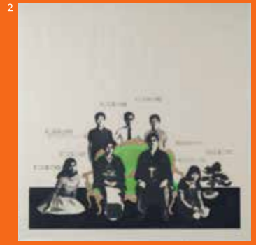
2 野田哲也《日記》1968年8月22日 1968年 熊本県立美術館蔵