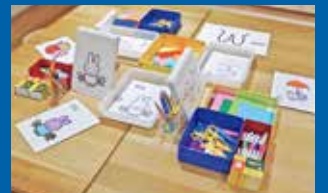
ワークショップコーナー(過去会場)

作品を見たあとは、実際に創作してみましょう。ブルーナのデザイン手法を体験できる「いろがみワーク」などができるワークショップコーナーを設けます。