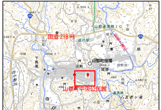
出典：国土地理院ウェブサイト(地理院地図/GSI Maps | 国土地理院) 地理院地図を編集・加工して作成