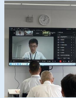
【オンラインの状況】