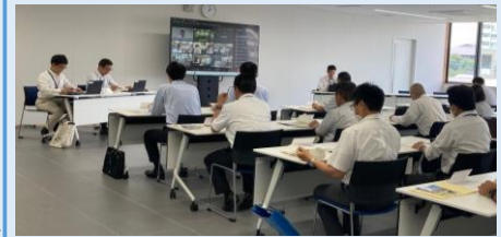
【対面での開催状況】