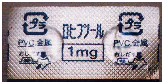
睡眠薬(ロヒプノール)