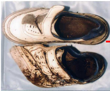
運動靴(TUF-TOP のロゴ入り 25.0cm)