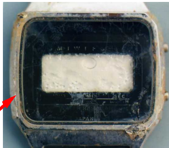
デジタル表示部分