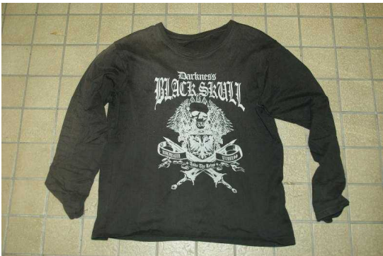
黒色長袖 T シャツ