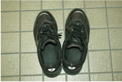
黒色運動靴（チャンピオン製、26.0cm）