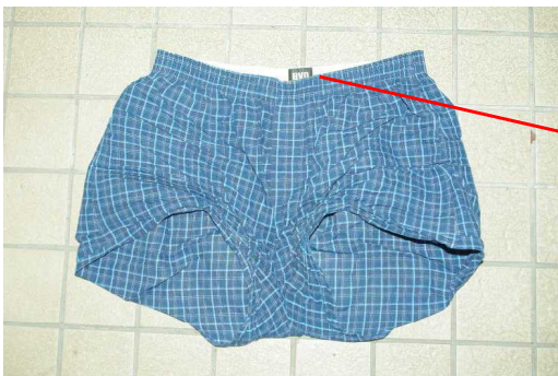
青色チェック柄トランクス