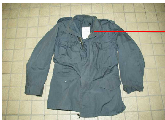
紺色防寒ジャンパー