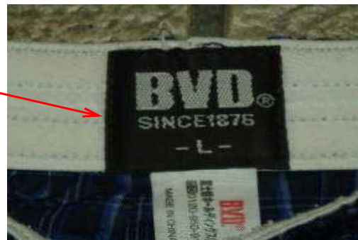
BVD 製、L サイズ