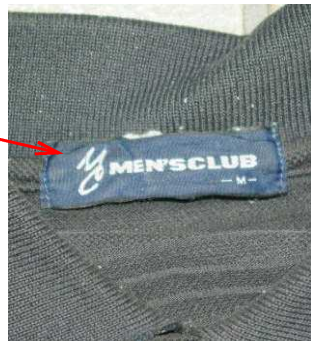
MEN'S CLUB 製、M サイズ