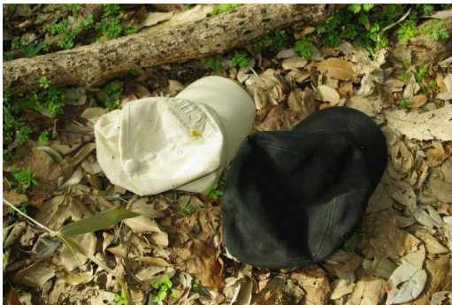
白色帽子、黒色帽子