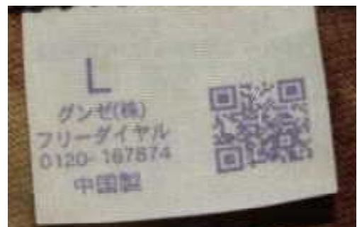
トランクス内側の商品タグ (表)