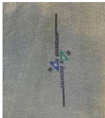
靴下くるぶし部のマーク