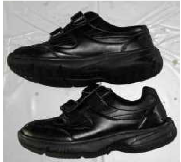
靴（黒色、サイズ27.0cm、品名VISIONQUEST、中国製）