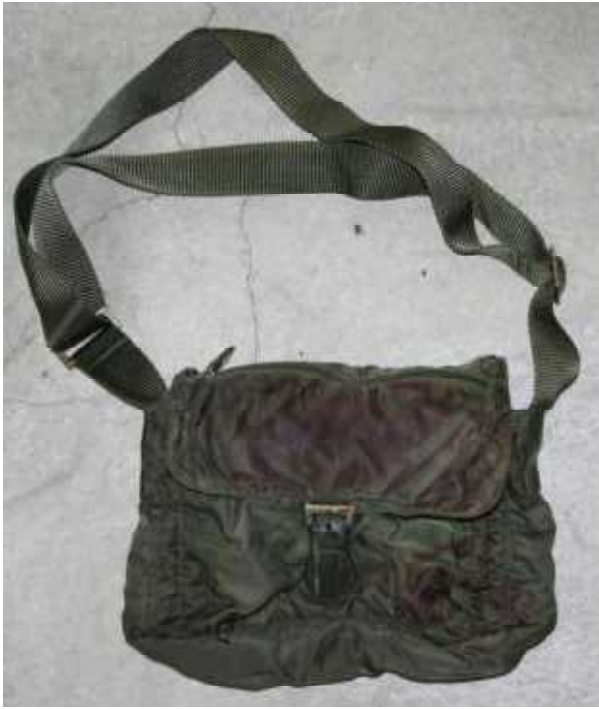
ショルダーバッグ（緑色）