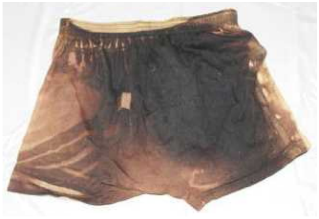
トランクス (G.T.HAWKINS、サイズL) 前面・裏面