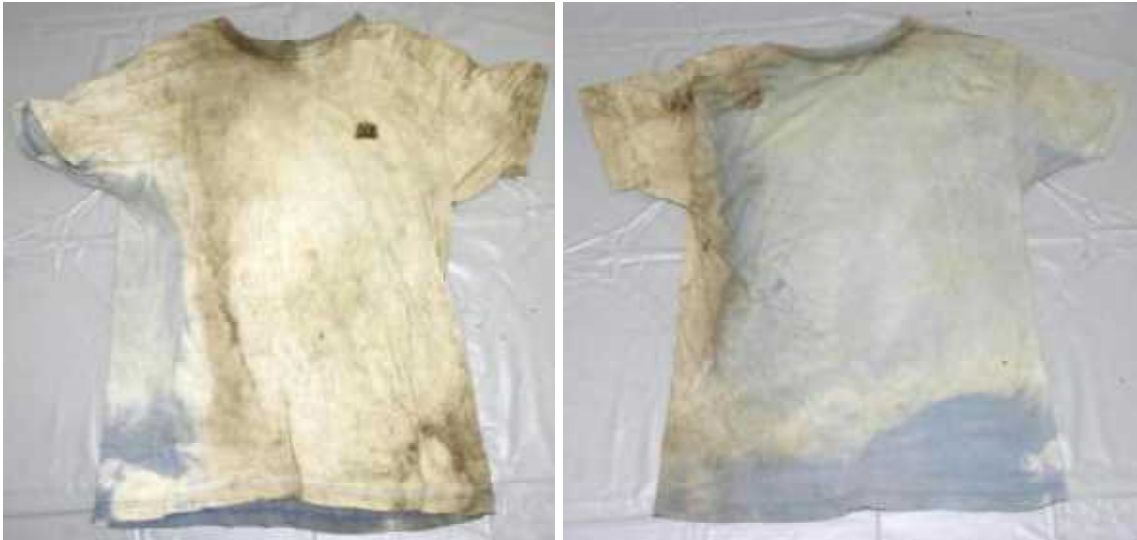
Tシャツ（G. T HAWKINS、中国製、グンゼ、Lサイズ）前・裏面