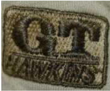
Tシャツの左胸ワンポイント刺繍