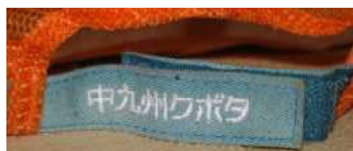
中九州クボタ 2015年（平成27年夏） グランメッセのイベントで来場者に配布された帽子