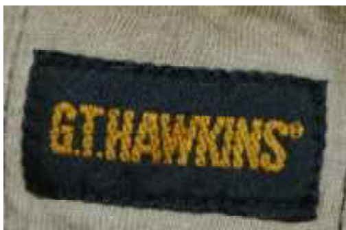
トランクス前面の商品タグ