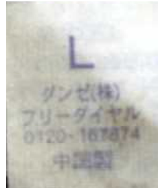
Tシャツのサイズ表記