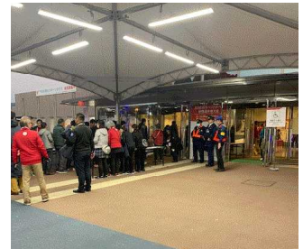
山鹿市総合体育館