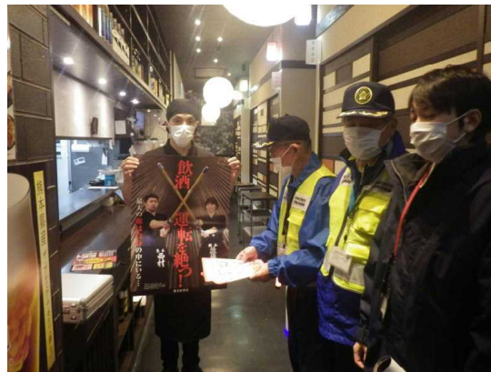
飲酒運転根絶啓発活動