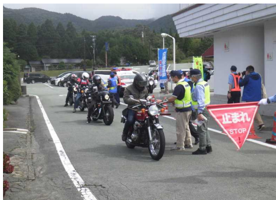
ツーリング事故防止啓発活動