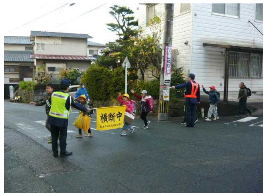
通学路における子供の見守り活動