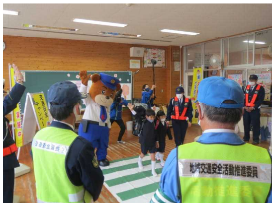
交通安全教育活動