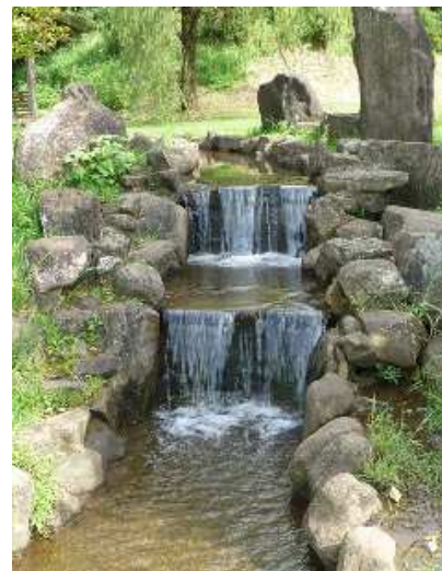
写真は矢護川公園です。

メモ: 河川の図、目に見た感じの川のきれいさ、きたなさ、魚や鳥がいたなど気づいたことがあったら書きとめておくで後で便利です。