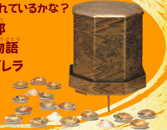
国指定重要文化財 《綾杉地獅子牡丹時絵婚調度 貝桶・彩色貝》 お姫様の嫁入り道具の一つ。