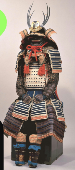
《白綾包紺糸威桶側六枚胸具足》 2番目のお殿さま綱政が ついていた鎧。