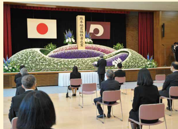
昨年の様子(令和2年4月14日)

熊本地震で犠牲になられた方々を追悼する「熊本地震犠牲者追悼式」は、新型コロナウイルス感染防止のため、昨年同様、規模を縮小し、開催します。なお、式終了後の一般献花は中止します。式典の様子は、動画にて生配信する予定です。動画の閲覧方法などの詳細は、4月上旬に、県ホームページ内で案内する予定です。